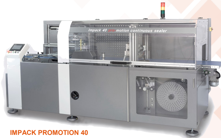
IMPACT PROMOTION 40

Ces machines peuvent être associées à un tunnel de rétraction. Elles travaillent à partir de film dossé, le cycle est entièrement automatique. Les produits à emballer sont déposés manuellement ou automatiquement sur une bande d'alimentation, une cellule horizontale ou verticale détecte automatiquement la longueur des produits ; de ce fait, il est possible de passer sans réglage des produits de longueurs différentes. Un conformateur réglable permet d'ajuster le positionnement du film en fonction de la section des produits. Le film est soudé autour du produit sur trois cotés grâce à un système de soudure coupe en continu par couteau chauffant et par une mâchoire fixe de soudure coupe transversale.